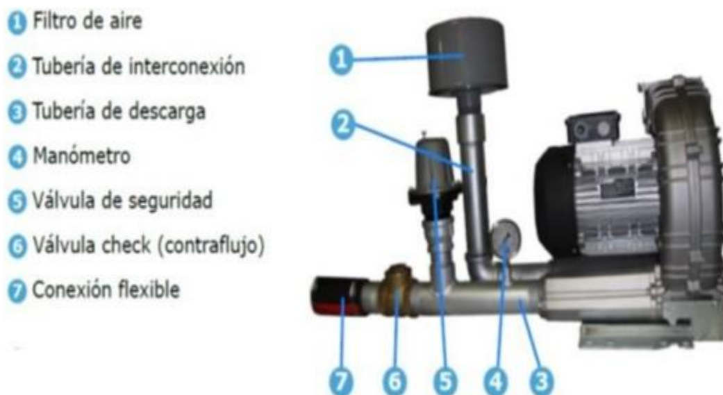
Figura 5. Imagen Demostrativa. Soplador.