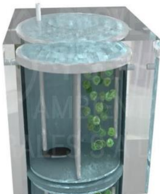
Figura 3. Imagen Representativa. Reactor Biológicos aerobio, con material plástico.