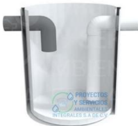
Figura 4. Imagen Representativa. Tanque de distribución de filtros.