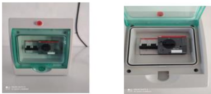
Figura 7. Imagen Representativa. Cuadro eléctrico.