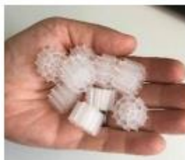
Figura 8. Imagen Demostrativa. Lecho fluidizado.