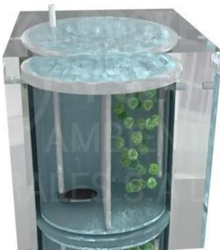
Figura 1. Imagen Demostrativa. Sistema Biológico de oxidación total por medio de inyección de oxígeno, con recirculación de lodos activados.

Extracción de lodos, se realizará con sistema creando el (efecto "Venturi"), el exceso de lodo pasa por una válvula el cual aumenta rápidamente su velocidad, esto provoca una presión negativa que es aprovechada para el desalojo de los lodos El sistema Venturi representa el sistema más económico y eficaz para extracción de lodos, con apoyo de los sopladores.