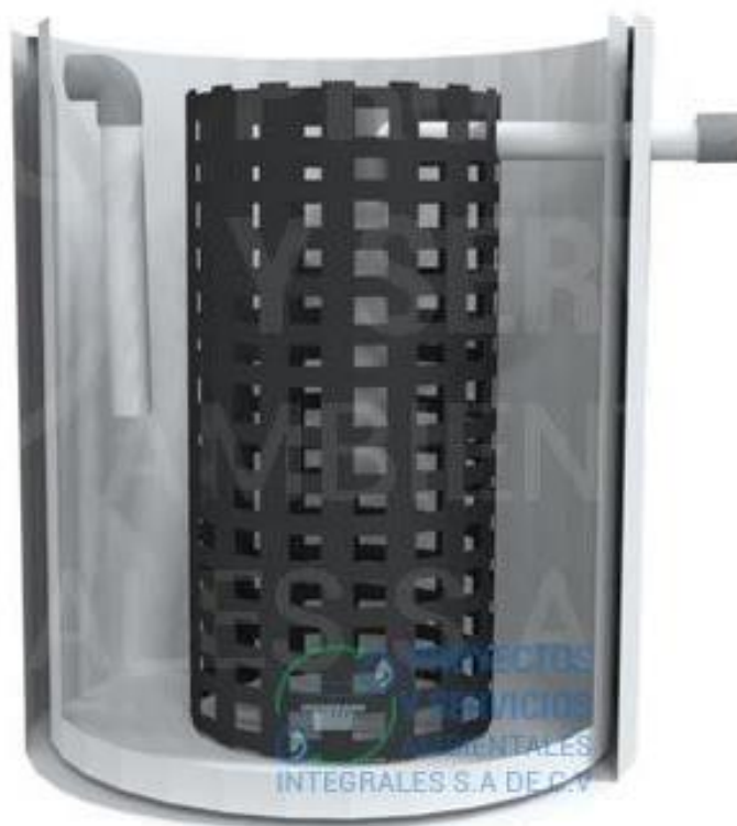
Figura 2. Imagen Demostrativa. Tamizado trampa de grasas, Manual Imagen representativa.